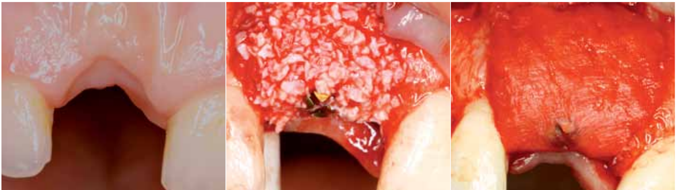
Horizontale und vertikale Augmentation: links Ausgangssituation, Mitte alloplastisches Knochenersatzmaterial, rechts Bindegewebstransplantat

Die therapeutische Zielrichtung, die sich hinter der Gebührennummer 9100 GOZ verbirgt, ist der Aufbau (Volumenzunahme) des Alveolarknochens. Dabei wird nicht unterschieden, ob dieser Aufbau horizontal (Aufbau der Dicke) und/oder vertikal (Aufbau der Höhe) erfolgt. Auch erfolgt keine Definition des Umfangs dieser Maßnahmen. Das Vorhandensein von Zäh-