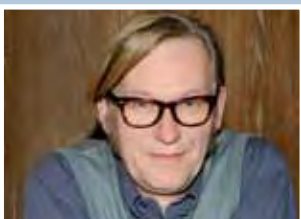
Frank Gustav Bloch