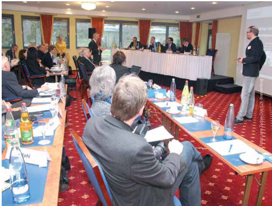
Die Koordinierungskonferenz Öffentlichkeitsarbeit tagte am 01./02.03.2013 im Hotel Victor's Residenz in Saarbrücken.