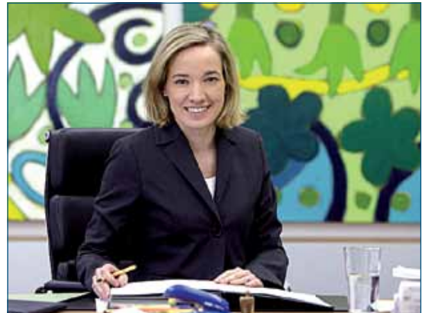
Dr. Kristina Schröder, Bundesministerin für Jugend

Der Boys' Day als besondere Berufsorientierungsaktion widmet sich parallel zum Girls' Day der Aufhebung von Geschlechterstereotypen in der Berufswahl. So wird Mädchen und Jungen eine Erweiterung ihrer Zukunftsoptionen ermöglicht.