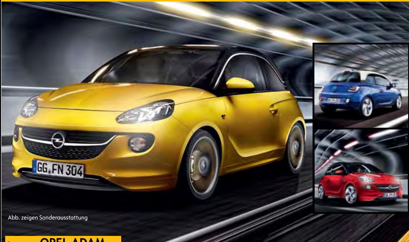
Abb. zeigen Sonderausstattung