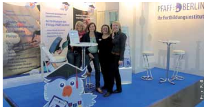
Die Mitarbeiter des Philipp-Pfaff-Instituts beraten Sie gerne am Messestand (hier auf der Fachdental in Leipzig).

A uch in diesem Jahr wird das Philipp-Pfaff-Institut mit einem eigenen Stand auf der Internationalen Dental Schau IDS in Köln vertreten sein. Vom 12.03.2013 bis zum 16.03.2013 finden Sie uns in Halle 11.2, Gang N, Stand Nr. 061. Nutzen Sie den Stand Ihres „Pfaffs“ als Anlaufstelle. Wir freuen uns auf Sie!