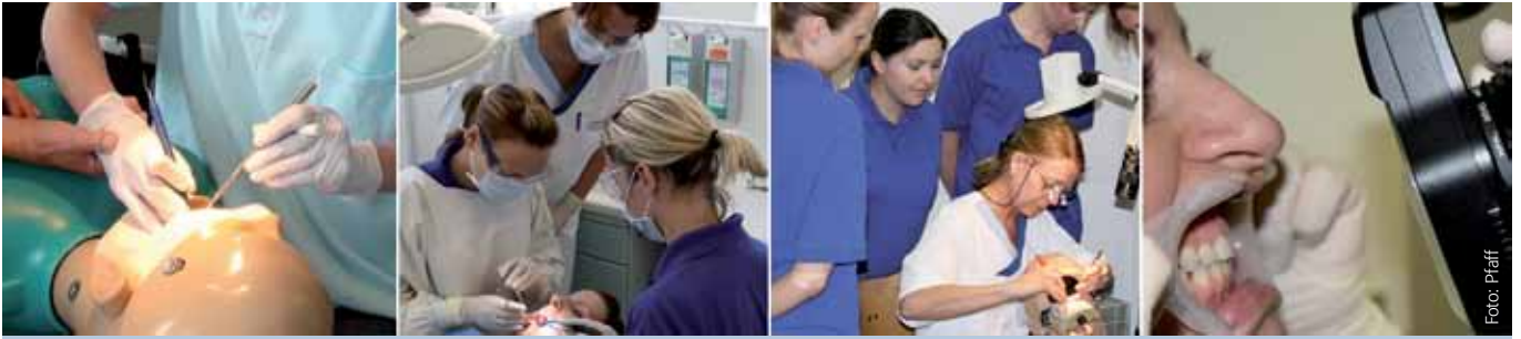
Exzellente Betreuung und intensive Behandlung von Patienten im Rahmen des DH-Seminars am Philipp-Pfaff-Institut