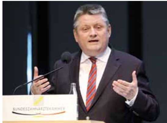
Hermann Gröhe, Bundesgesundheitsminister