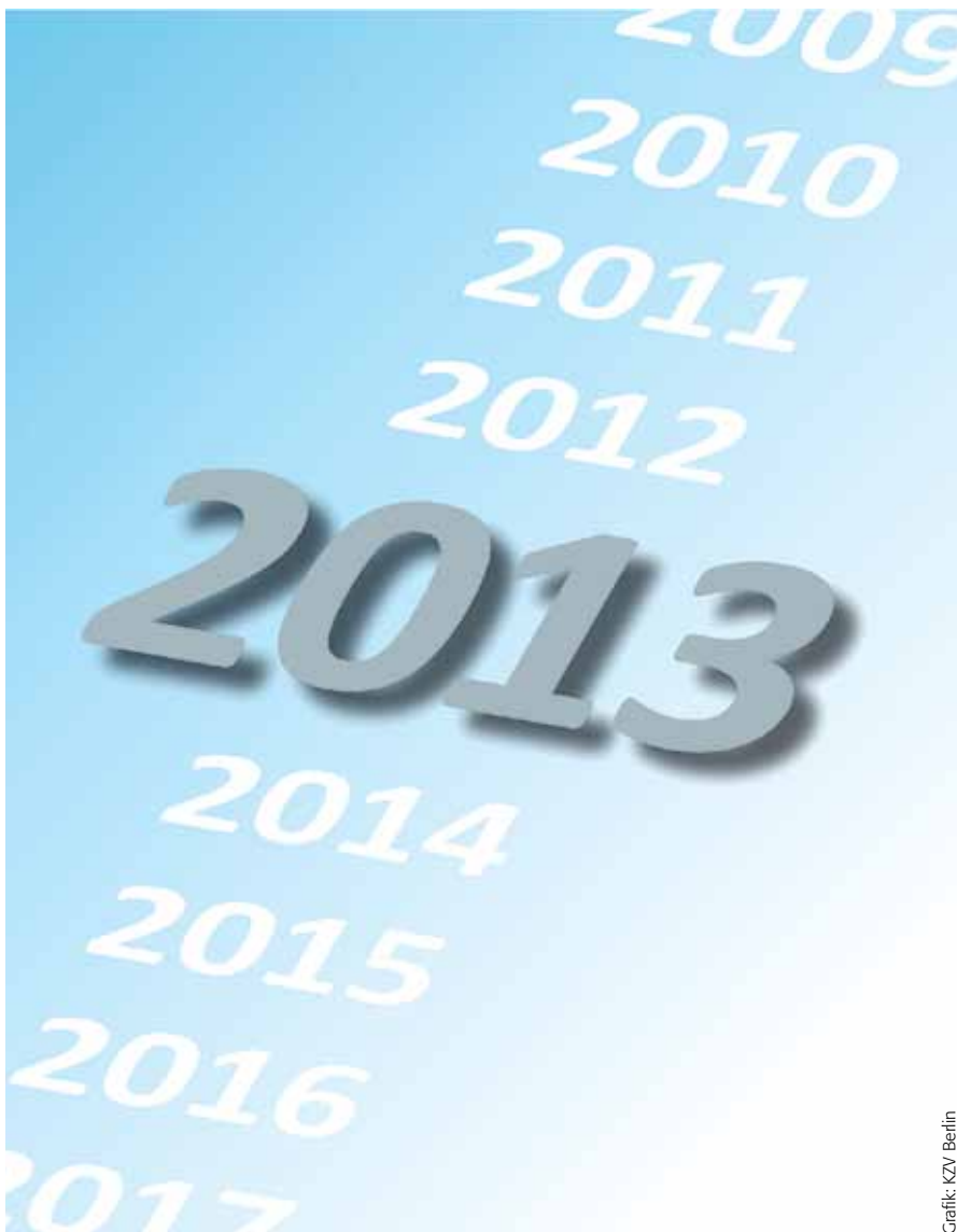
Grafik: KZV Berlin

das Rentenversicherungsniveau sowie die Verbeitragung aller Einkommensarten. Unterschiede bestehen ebenso im Finanzierungsprinzip sowie in der Ausgestaltung der Familienversicherung.