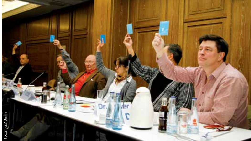
Die Vertreterversammlung stimmt ab

Dennoch kritisierten einige Mitglieder die in ihren Augen noch vorhandenen unklaren Formulierungen. Es wurde betont, konstruktive Änderungsvorschläge in die Formulierungen einfließen zu lassen. Derartige Vorschläge blieben jedoch letztlich aus. Für den Vorstand ist die hier beschriebene Regelung eindeutig formuliert und gängige Praxis; er betonte nochmals, dass