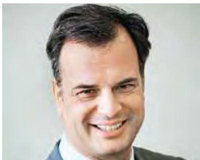
Dr. Michael Dreyer

Kein neues Thema; schon im alten China wurden Ärzte dafür bezahlt, ihre Patienten gesund zu erhalten. Bereits die chinesischen Heiler rieten zu gesundheitsförderlichen Verhaltensweisen, um damit gesundheitliche Risiken zu reduzieren, wie es im aktuellen Gesetzentwurf formuliert ist. Wie weit die alten Chinesen damals auch an die Verbesserung der Rahmenbedingungen für die betriebliche Gesundheitsförderung sowie die Förderung des Wettbewerbes der Krankenkassen gedacht haben, ist nicht überliefert. Die Einrichtung einer Ständigen Präventionskonferenz beim Bundesgesundheitsministerium wird sicherlich nicht ihr Ziel gewesen sein, im Zweifelsfalle aus Kostengründen.