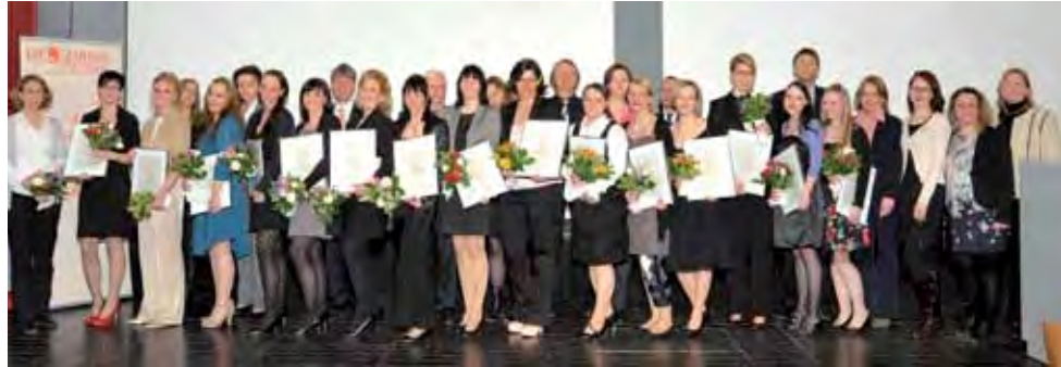
Der Jubiläumskurs – mehr als 100 DH hat das Philipp-Pfaff-Institut in den letzten sieben Jahren fortgebildet.

Für die Behandlung und Betreuung der Patienten sei es unerlässlich, fortgebildete Mitarbeiter/innen zu haben, die zum einen genaue Kenntnisse des Krankheitsbildes im gesamten medizinischen Kontext besitzen und zum anderen auch die kommunikativen Kompetenzen, um den Patienten umfassend zu betreuen. Diese Arbeit ist nicht nur für den Patienten eine große Bereicherung, sondern auch für den Berufsstand. Dafür ist es jedoch notwendig und wichtig, im Team zu arbeiten und Kompetenzen an Mitarbeiter zu delegieren. Die Strukturen für diesen Delegationsrahmen zu schaffen, ist Aufgabe der BZÄK als Vertretung des Berufsstandes. Die Ausgestaltung liegt in Händen der kammereigenen Institutionen wie das Philipp-Pfaff-Institut. Sie übernehmen mit ihren breitgefächerten Fortbildungsinhalten im Auftrag des Berufsstandes die umfassende Fortbildung der Mitarbeiter. Sie gewährleisten darüber hinaus, dass profunde fachliche