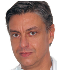
ZA W.-M. Boer